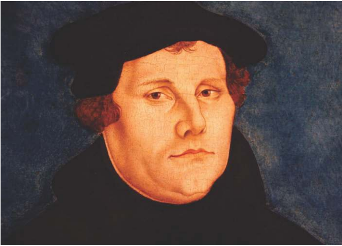
Martin Luther portréja-Idősebb Lucas Cranach munkája

Értelmező szótárunk a REFORM magyarázatát úgy fogalmazza meg, mint a haladást, korszerűsítést segítő részleges vagy fokozatos átalakítást, változtatást. Politikai vonatkozásban a fennálló rendet alapjaiban nem érintő társadalmi, politikai, gazdasági változtatást, újítást jelenti.