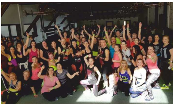
Fittnes Groove - Cheile Gradistei 2019

În fiecare an, în ziua de 22 aprilie se sărbătorește Ziua Pământului, ziua când s-a născut mișcarea pentru protejarea mediului înconjurător. Această mișcare s-a născut în SUA într-o perioadă când au avut loc mai multe evenimente deosebite.