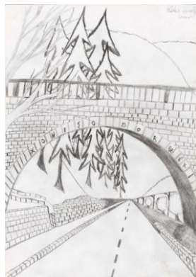
Elekes László - Borsec