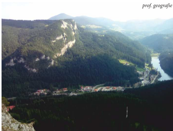
Stațiunea Lacul Roșu